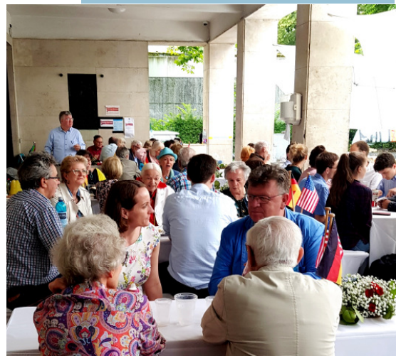
Foto oben:: Nach Umzug unter das Verandadach, regen-geschützt, waren weiterhin gut-gestimmte Table-Talks.